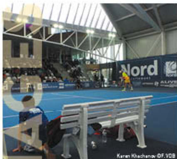
Karen Khachanov