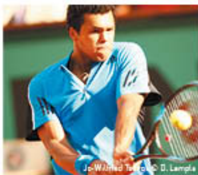
Jo-Wilfried Tsonga