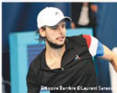
Grégoire Barrère