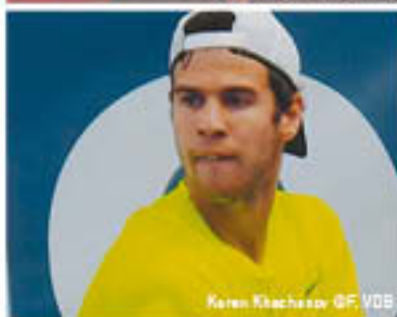
Keren Khachanov