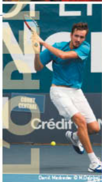
Daniil Medvedev