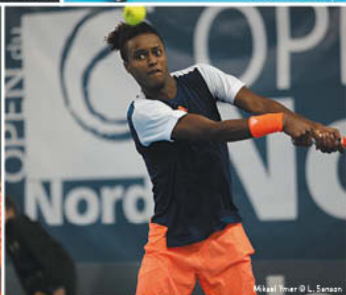
Mikael Ymer