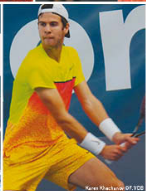
Karen Khachanov