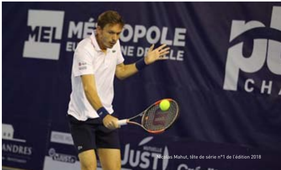
Nicolas Mahut, tête de série n°1 de l'édition 2018