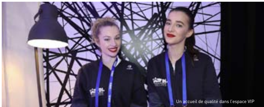
Un accueil de qualité dans l'espace VIP