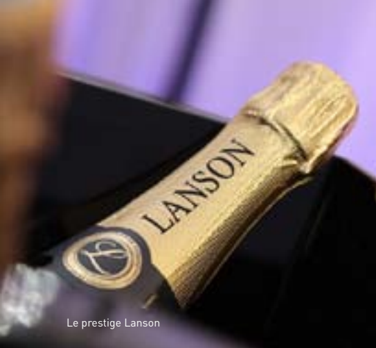
Le prestige Lanson