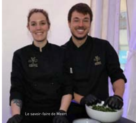
Le savoir-faire de Meert